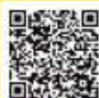
予算特別委員会の動向 (R4.6.13)