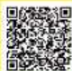
HPVワクチンの議事録 (R4.6.13)