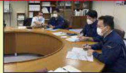
県政クラブで県庁から災害状況を聴取