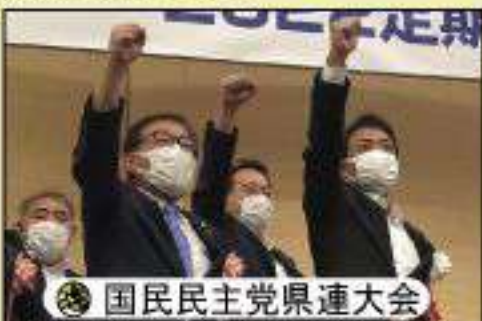
国民民主党県連大会