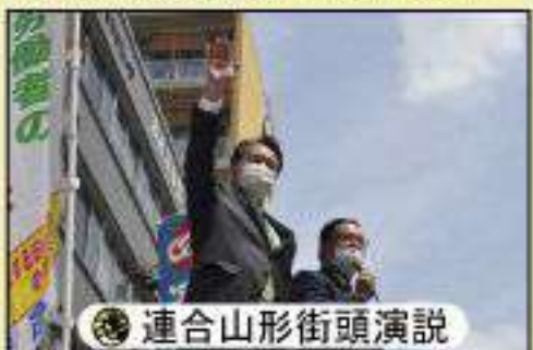
連合山形街頭演説