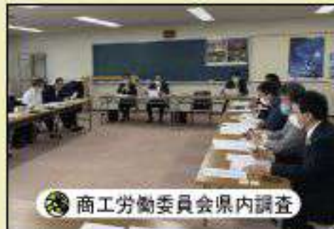
商工労働委員会県内調査