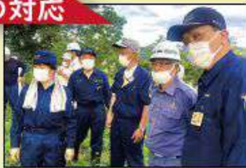
飯豊町小白川の大巻橋崩落現場を調査