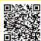
田んぼダムの議事録 (R3.8.19)