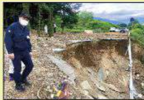
長井市寺泉の道路崩落現場を調査